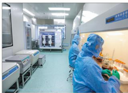
注射用戈氏梭菌芽孢冻干粉 发酵粗提洁净区