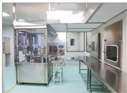
注射用戈氏梭菌芽孢冻干粉 灌装冷冻洁净区

现有员工56人，拥有先进设施设备和多个省级平台及海外研发机构，科研成果突出，已获授权国内外发明专利30项；承担国家、省市科研项目27项。在研生物1类新药“注射用戈氏梭菌芽孢冻干粉”为国际首个获批临床试验的细菌溶瘤药物，并获国家重大新药创制专项立项，目前正在开展I期临床试验；细胞与干细胞产品治疗已成功应用于临床；阿尔茨海默病诊断试剂盒、肿瘤早期诊断试剂盒的研究均获省重点研发计划立项，即将实现产业化，服务于民。